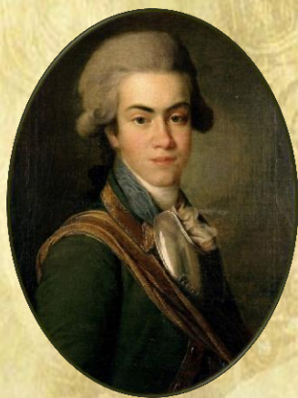
Долгорукий (Долгоруков) И. М.

На протяжении многих десятилетий единственным публичным увеселением для пензенцев были ярмарочные балаганы, но к концу XVIII века скоморошьи представления отступили перед новым типом зрелищ — спектаклями любительских, крепостных и казённых театров.