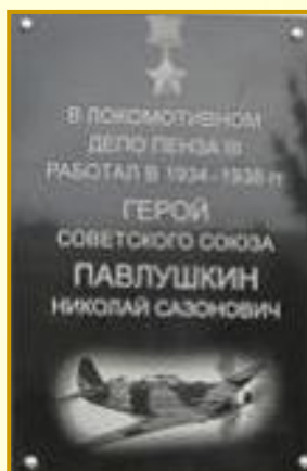
Мемориальная доска в депо «Пенза III» в Пензе