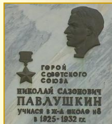
Мемориальная доска на школе № 8 в Пензе

В честь Николая Павлушкина названа одна из улиц Пензы. На здании локомотивного депо в Пензе установлена мемориальная доска.