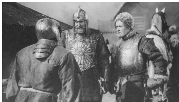
Кадр из х/ф «Минин и Пожарский»

Вместе с Натаном Зархи Пудовкин работал над фильмами «Конец Санкт-Петербурга» и «Потомок Чингисхана».