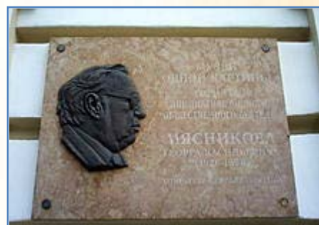
Мемориальная доска на здании Музея одной картины в Пензе